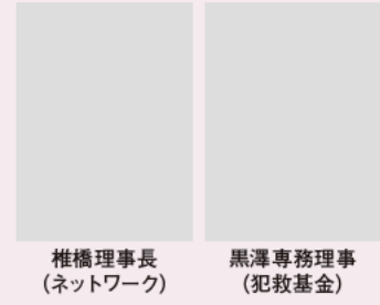
椎橋理事長 (ネットワーク)

(フォーラム及び研修会は一般財団法人ひまわり基金の助成事業により一部を執行しています)