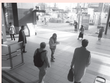
岡山駅構内における広報活動

ことが難しいです。ネットワークには、財政基盤の強化支援、行政への働きかけ、犯罪被害者基金の創設などの面で期待しています。